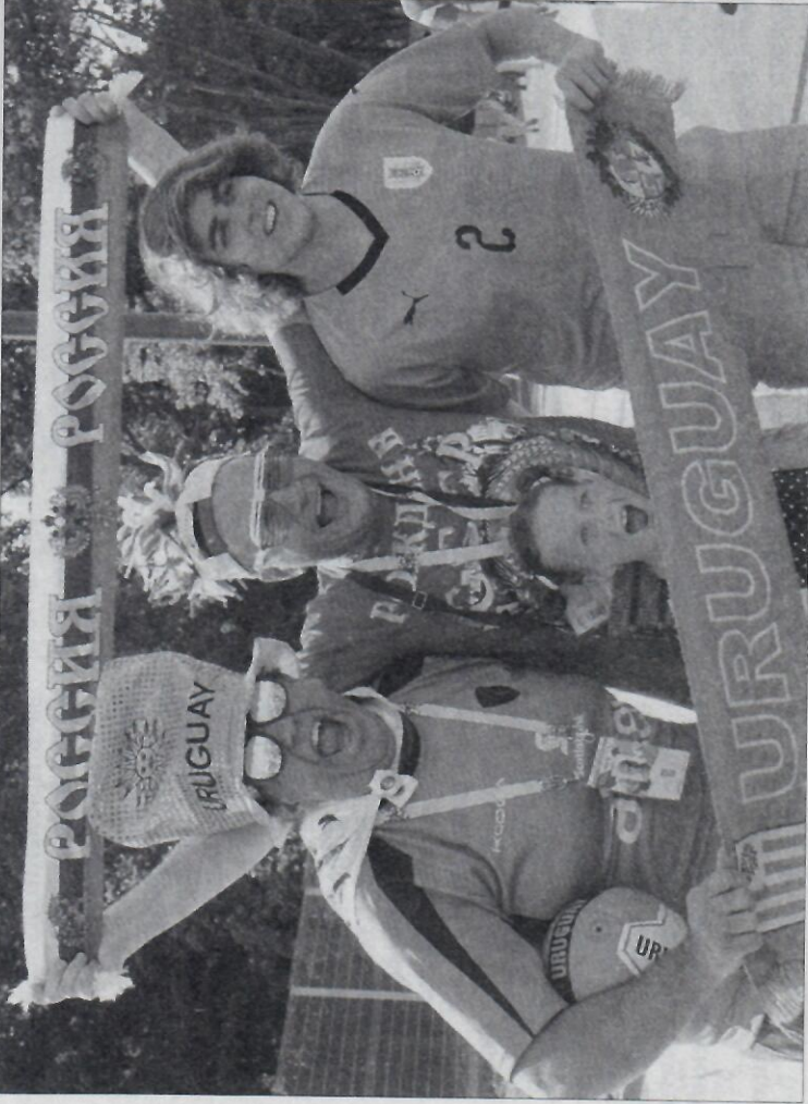
ФАНАТЫ. Российские и уругвайские болельщики с удовольствием позировали для прессы.

С надеждой и верой в отечественный футбол вернулись домой и мы. Будем болеть за нашу сборную 1 июля, когда в 1/8 финала она сыграет в Мадриде с командой Испании.